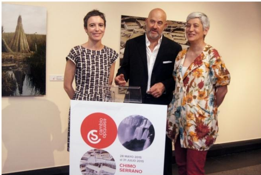
La muestra se enmarca, como una de las sedes invitadas, de 'PHotoEspaña 2015'.